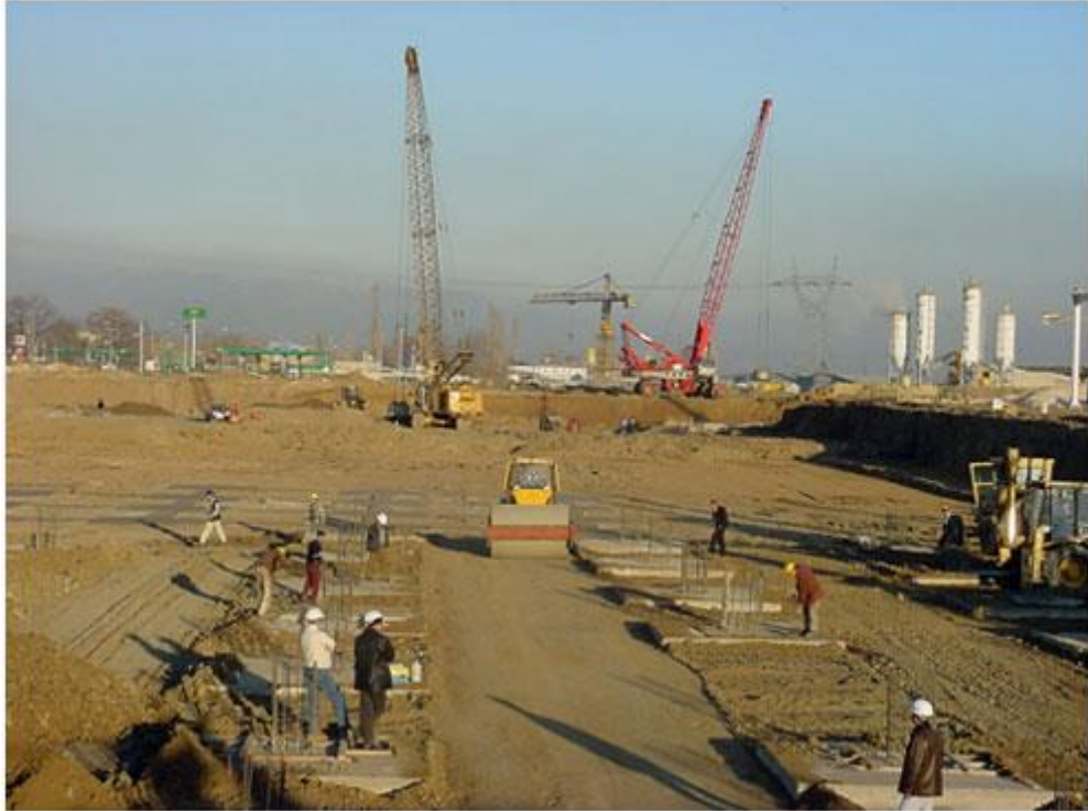
Carrefoursa Bursa dinamik yer deęiřtirme ve dinamik kompaksiyon uygulaması